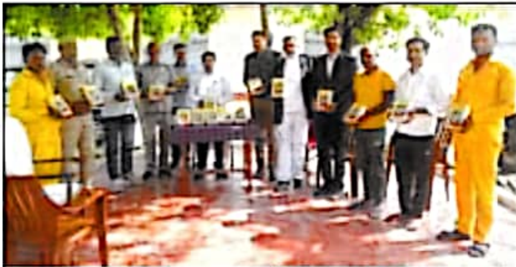
जिला कारागार में आयोजित शिविर में श्रीराम चरित मानस लिए बंदी

उक्त सम्बन्ध में भी जिला कारागार बन्दियों को सम्बन्धित