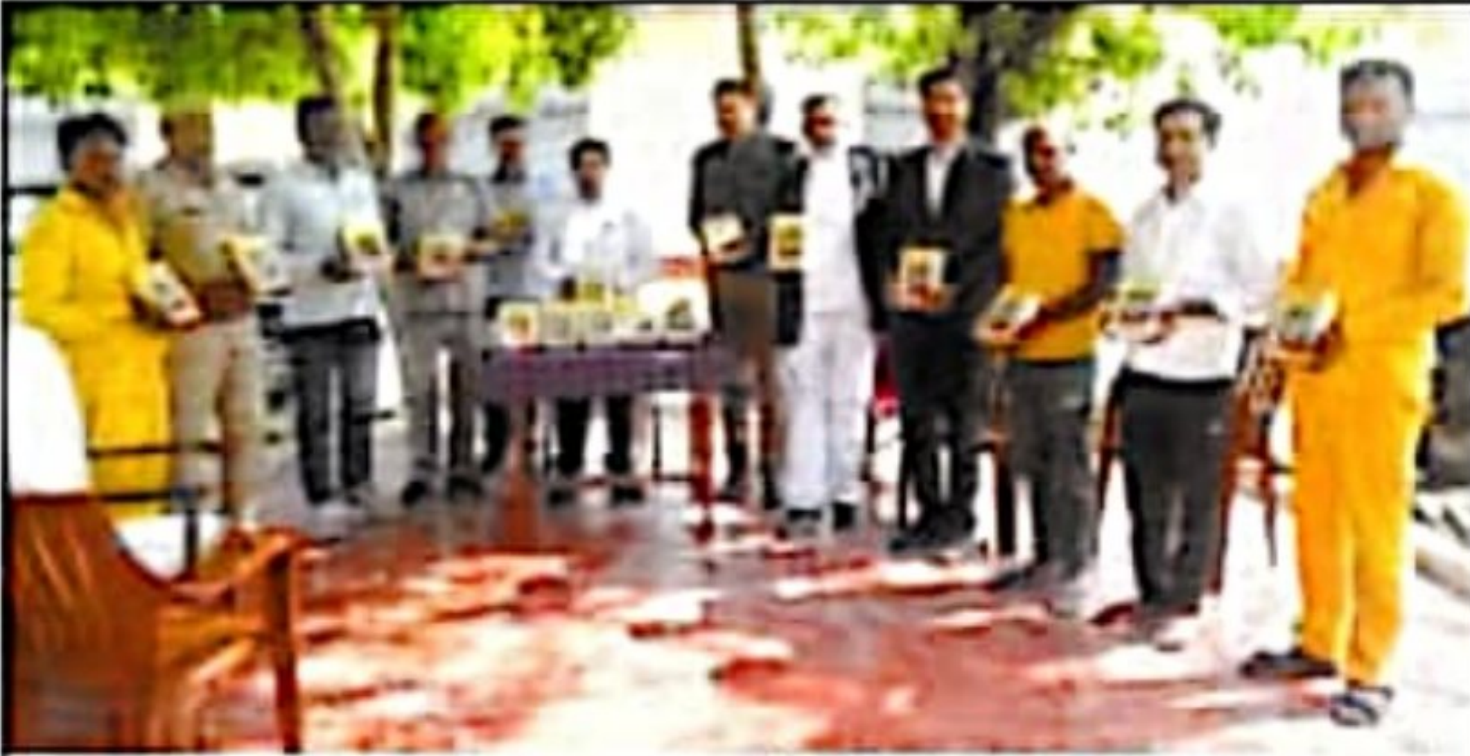
जिला कारागार में आयोजित शिविर में श्रीराम चरित मानस लिए बंदी