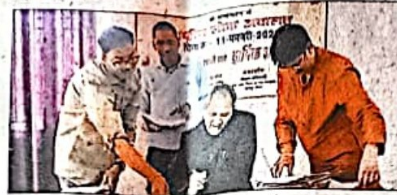
तहसील में मामले निस्तारित करते एसडीएम।