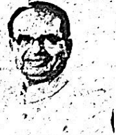
शिवराज सिंह चौहान, मुख्यमंत्री